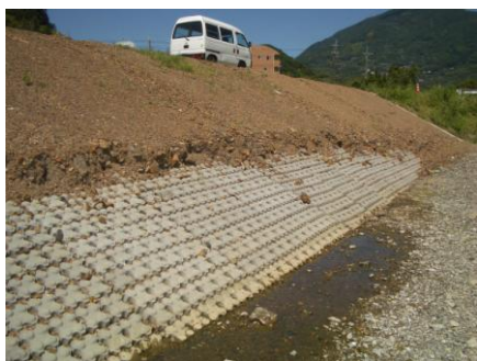
覆土が流出しブロックが出てきた法面部分 (島田橋付近)

5 月 31 日の大雨により覆土が流出 (左図)、一部のブロックが見える状況になっていますが、土の堤防 (本体) そのものは損傷を受けておらず、安全性は保たれています。将来の姿としては、覆土部分には草が茂り、下部の流出した部分は、上流からの土砂が自然堆積し、ブロックを覆い「堤防全体が緑に覆われるようになる計画」とのことです。(高知県須崎土木事務所より)