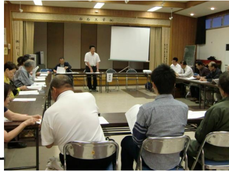
平成22年度 吾桑地区青少年を育てる会決算報告書

17日(火)公民館2階ホールで、23年度の青少年を育てる会総会が、27名の出席で開催されました。22年度の活動報告・決算報告をし、23年度事業計画案・予算案の認証を受けました。警察・保育園小学校・中学校の校長先生方からお話を聞き、意見交換ができました。