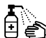
手指消毒用アルコール による消毒の励行

新型コロナワクチンの有効性・安全性などの詳しい情報については、厚生労働省ホームページの「新型コロナワクチンについて」のページをご覧ください。