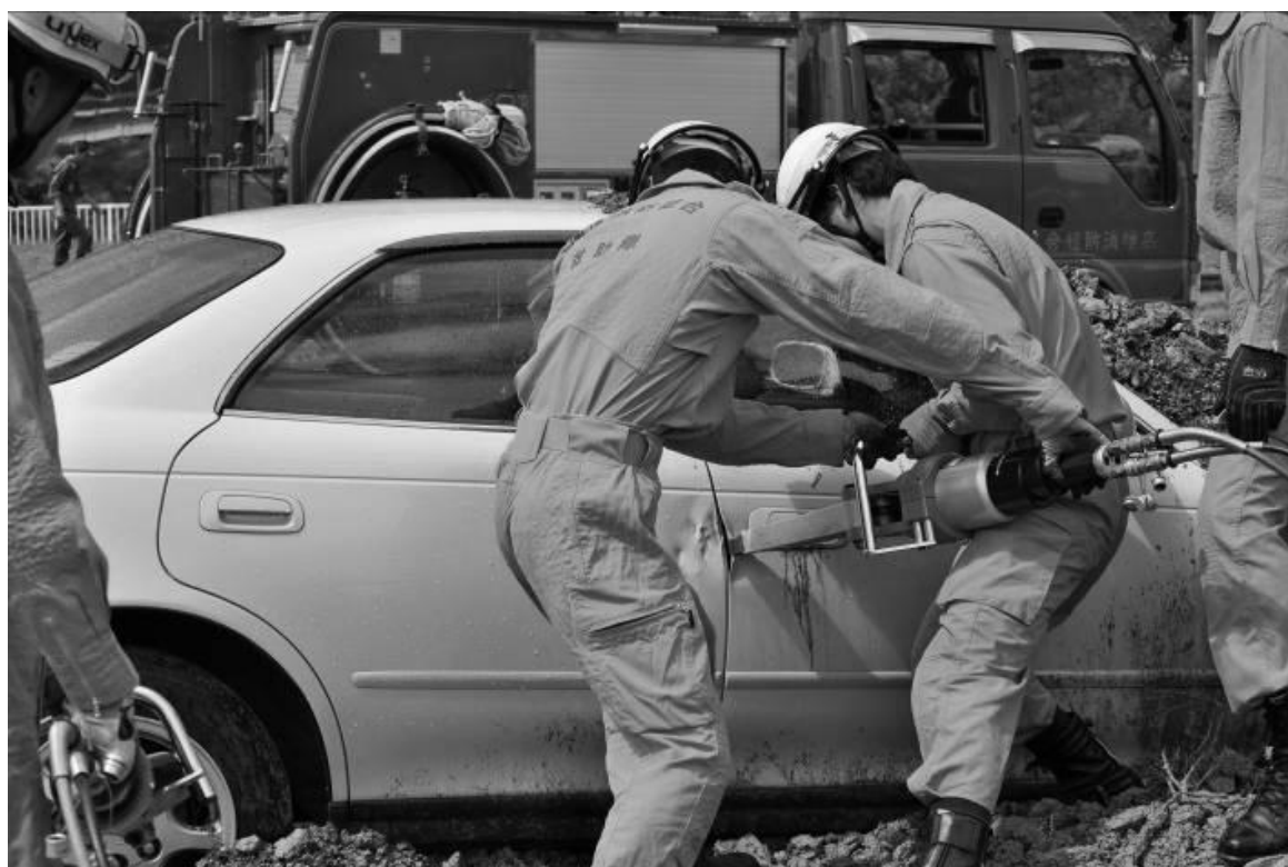
平成22年度須崎市総合防災訓練より