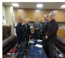
須崎市長と高陵保護司会役員との懇談