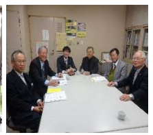
榑原町と高陵保護司会役員との懇談