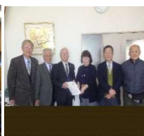
中土佐町と高陵保護司会役員との懇談