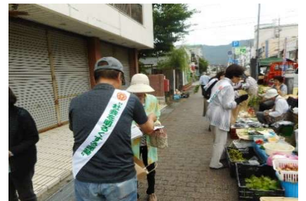
木曜市で街頭啓発活動に取り組む