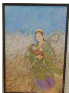
風花 (悲母観音 No. 5)