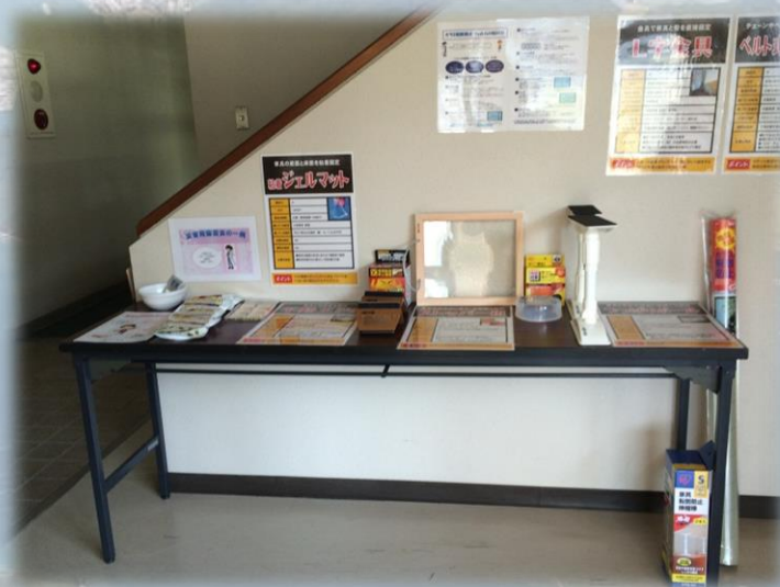
防災連絡協議会に展示した家具転倒防止金具の一例