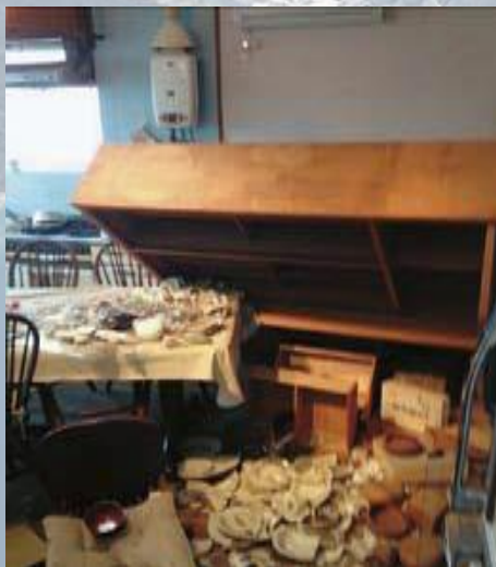
固定してなかったら

地震発生時に一番大切なことは、揺れから自分の身を守ることです。 地震の揺れによって、家具が倒れて、けがをしないよう、ご自宅の家具を固定するなど、少しずつ対策を進めましょう!!