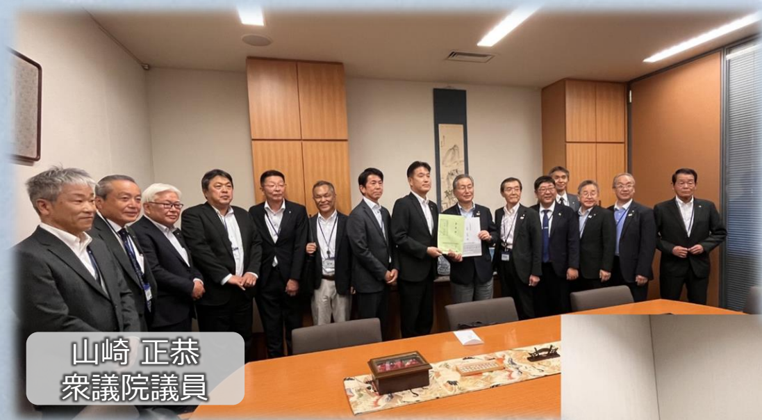
山崎 正恭 衆議院議員