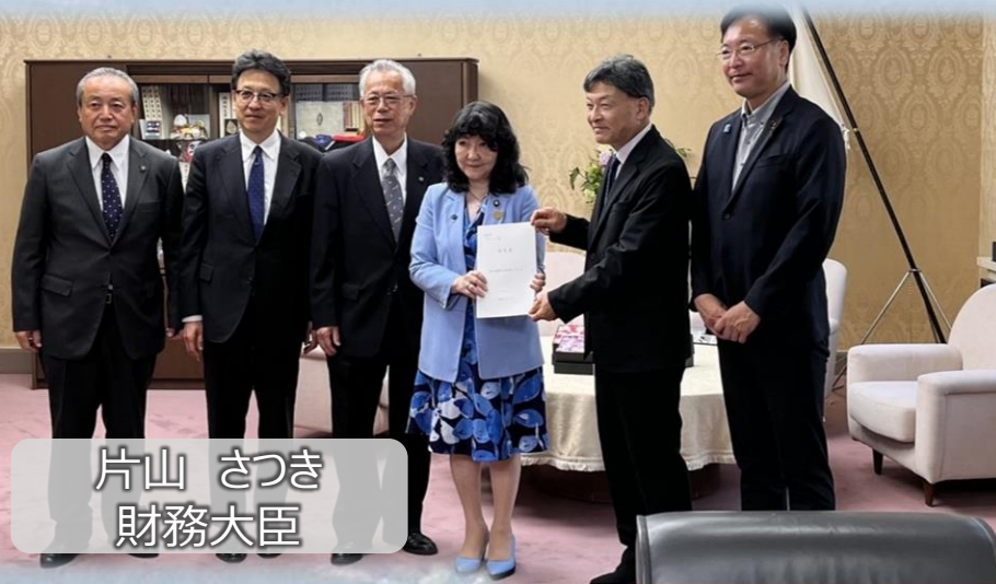
片山 さつき 財務大臣