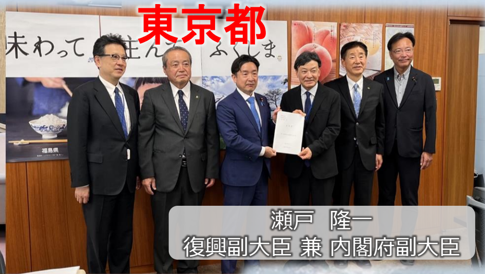
瀬戸 隆一 復興副大臣 兼 内閣府副大臣