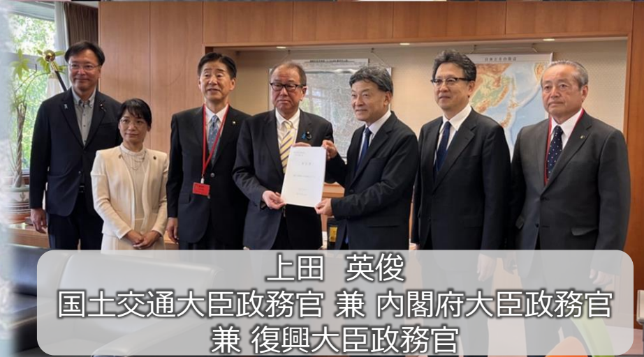
上田 英俊 国土交通大臣政務官 兼 内閣府大臣政務官 兼 復興大臣政務官