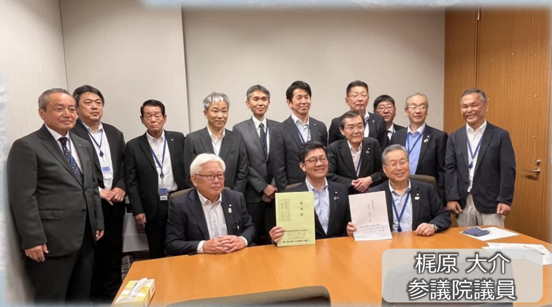
梶原 大介 参議院議員