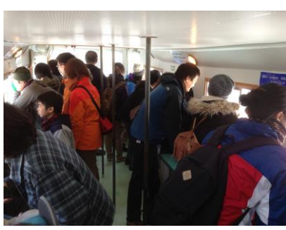
皆で巡航船の中から観察

このメニューは須崎野 外博物館でも何回か開催 されているのですが、今 回初めてカンムリカイツ ブリを観察することが出 来ました。そのほか、ミ サゴやダイサギ、アオサ ギなども観察しました。