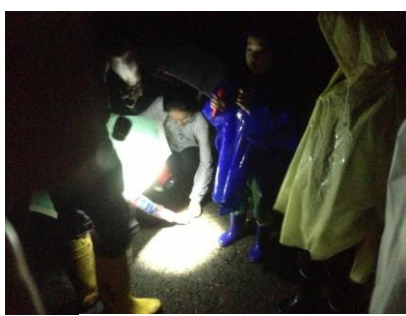
わずかな灯りで観察

ら4種類(トノサマガエ ル・ヌマガエル・アマガ エル・シヌノーゲルアオ ガエル)を確認しました。