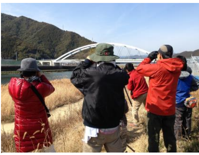
各々双眼鏡や望遠鏡を持参し観察

当日はコガモやオナガ ガモ、ヒドリガモなどカ モの仲間だけでなく、セ グロカモメやユリカモ メ、アオアシシギ やイソシギなど多くの種 類の冬鳥を観察すること が出来ました。