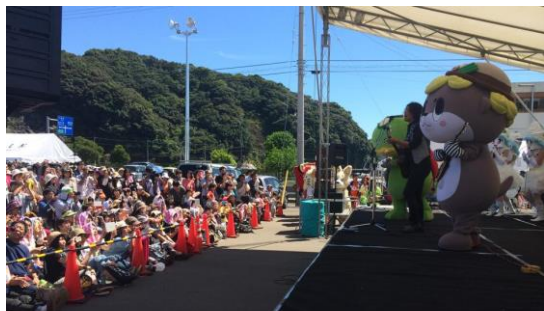
ステージではご当地キャラバンドと共にギター演奏♪

須崎市市制施行60周年記念イベントとして、9月13日・14日に「ご当地キャラクターまつりinすさき」が須崎市桐間多目的公園で開催されました。全国各地から約70体のキャラクターをお招きしての四国最大級のキャラクターイベント。当日はキャラクターステージや各地のご当地グルメが味わえるうまいもんブースもあり、2日間で5万人もの来場者があり、大変賑わいました。