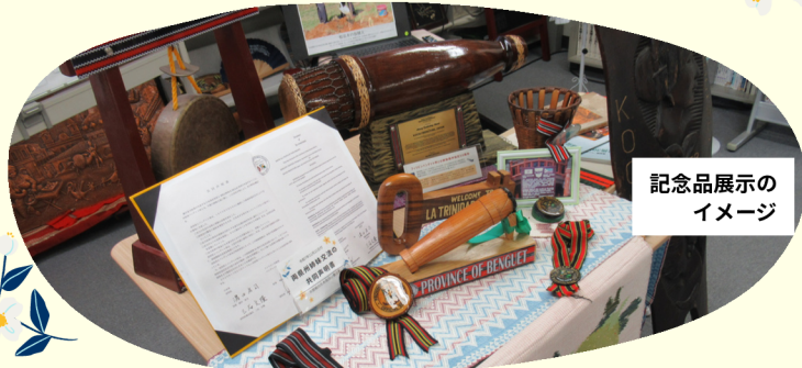
記念品展示のイメージ