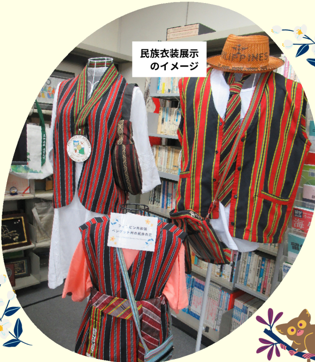
民族衣装展示のイメージ