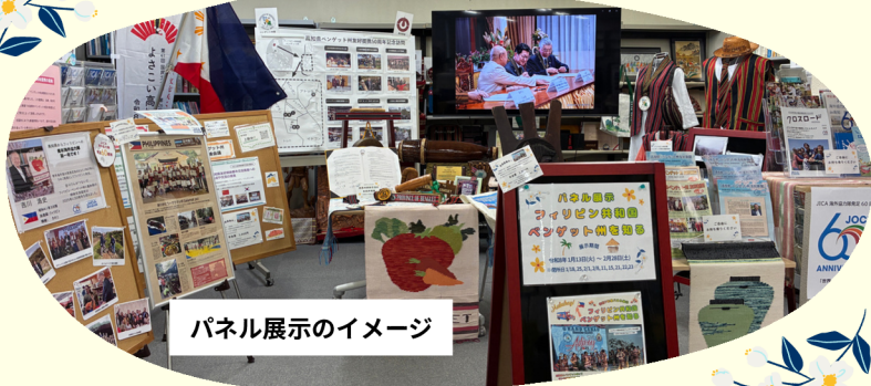
パネル展示のイメージ