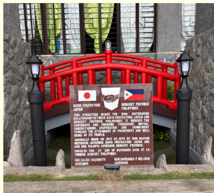
友好提携記念碑 (ベンゲット州庁舎内)