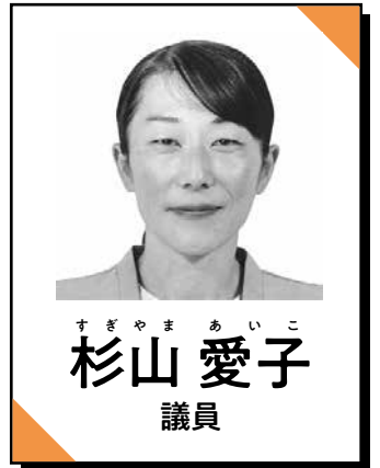
すぎやま あいこ 杉山 愛子 議員