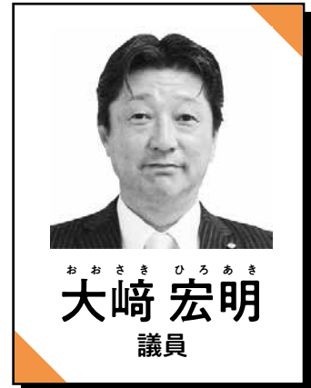
おおさき ひろあき 大崎 宏明 議員