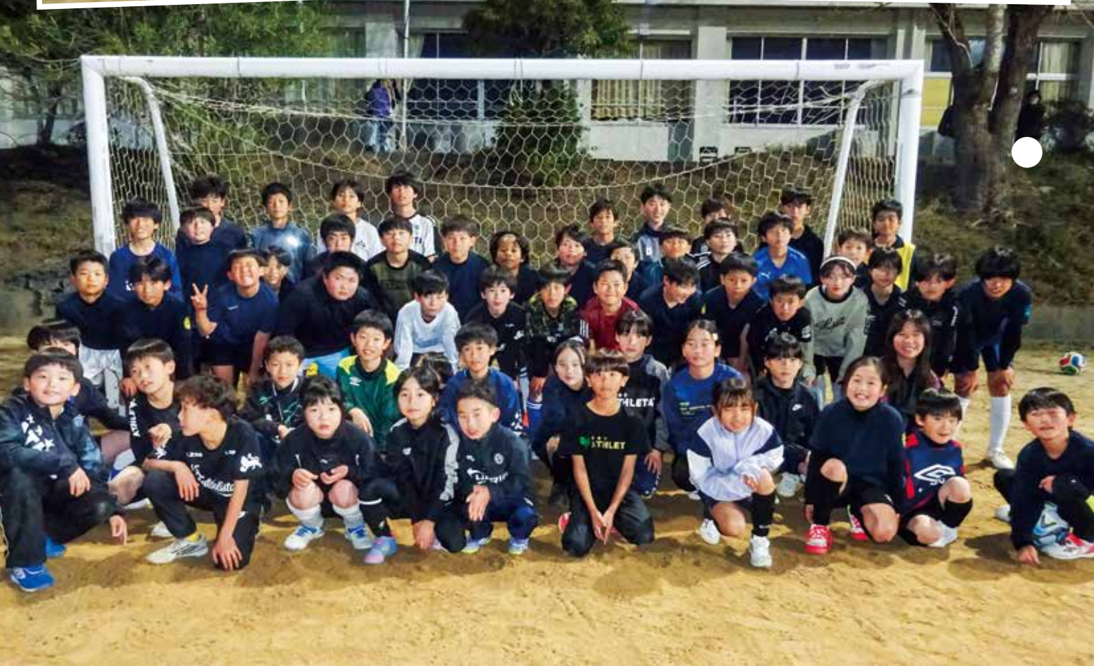
須崎少年サッカースクールの皆さん