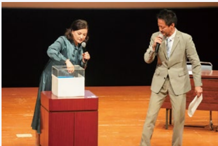
▲サインのプレゼントに会場は大盛り上がり!