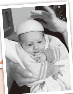
文旦の皮を帽子にしました!

今年何か新しいことを始めてみませんか? 新しい自分で新年を迎えるには、ほんの小さな目標を持つだけでも十分ですよ! 寒さに気をつけて、良いお年をお迎えください!