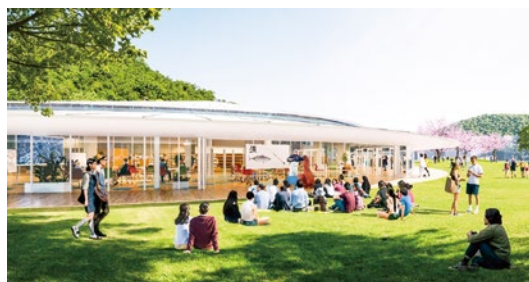
施設と一体的に整備される屋外空間(イメージ)