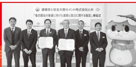
11月18日「須崎市と住友大阪セメント(株)との包括連携に関する協定」締結式

須崎市は住友大阪セメント(株)と包括連携協定を締結しました。本協定は、同社の廃棄物処理技術を活用しながら、災害廃棄物処理や地域活性化、環境負荷低減など8項目で密接に連携し、持続可能な地域社会の形成と住民サービスの向上を図るものです。