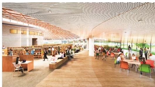
思い思いの過ごし方が共存する屋内空間(イメージ)