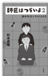
師匠はつらいよ2 【杉本昌隆 著】