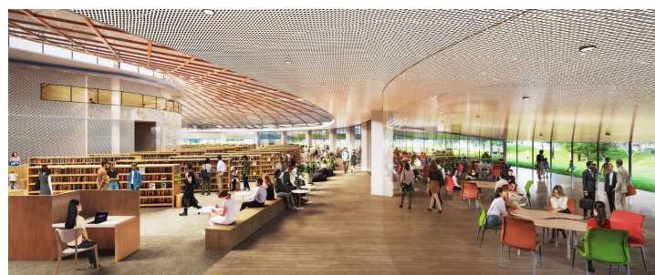
思い思いの過ごし方が共存する屋内空間（イメージ）

須崎市図書館等複合施設は、図書館だけではなく、利用者ひとりひとりが新しい“何か”を見つけられる出会いの場となることを目指しています。 じっくり本を読めることはもちろん、さまざまな活動ができる会議室にホール、最新技術に触れられるPCルームや、子どもと一緒に遊べるキッズパーク等を整備します。多様な過ごし方が共存できる、新しい価値観で新しい須崎を創るための拠点となる施設づくりを行います。 本施設が長く親しまれ、市内外の多くの方に愛される存在となるよう、施設の愛称を募集します。