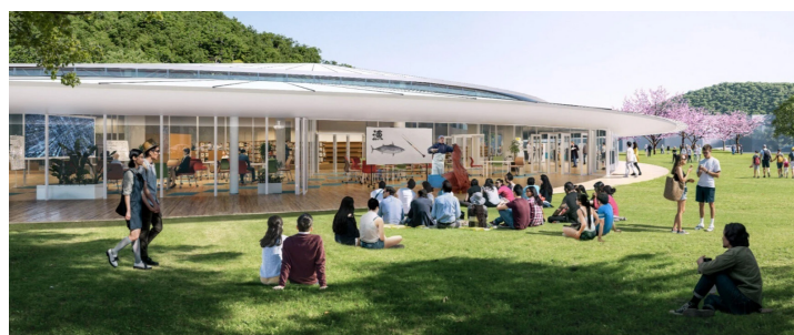
施設と一体的に整備される屋外空間（イメージ）