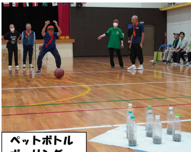
ペットボトル ボーリング